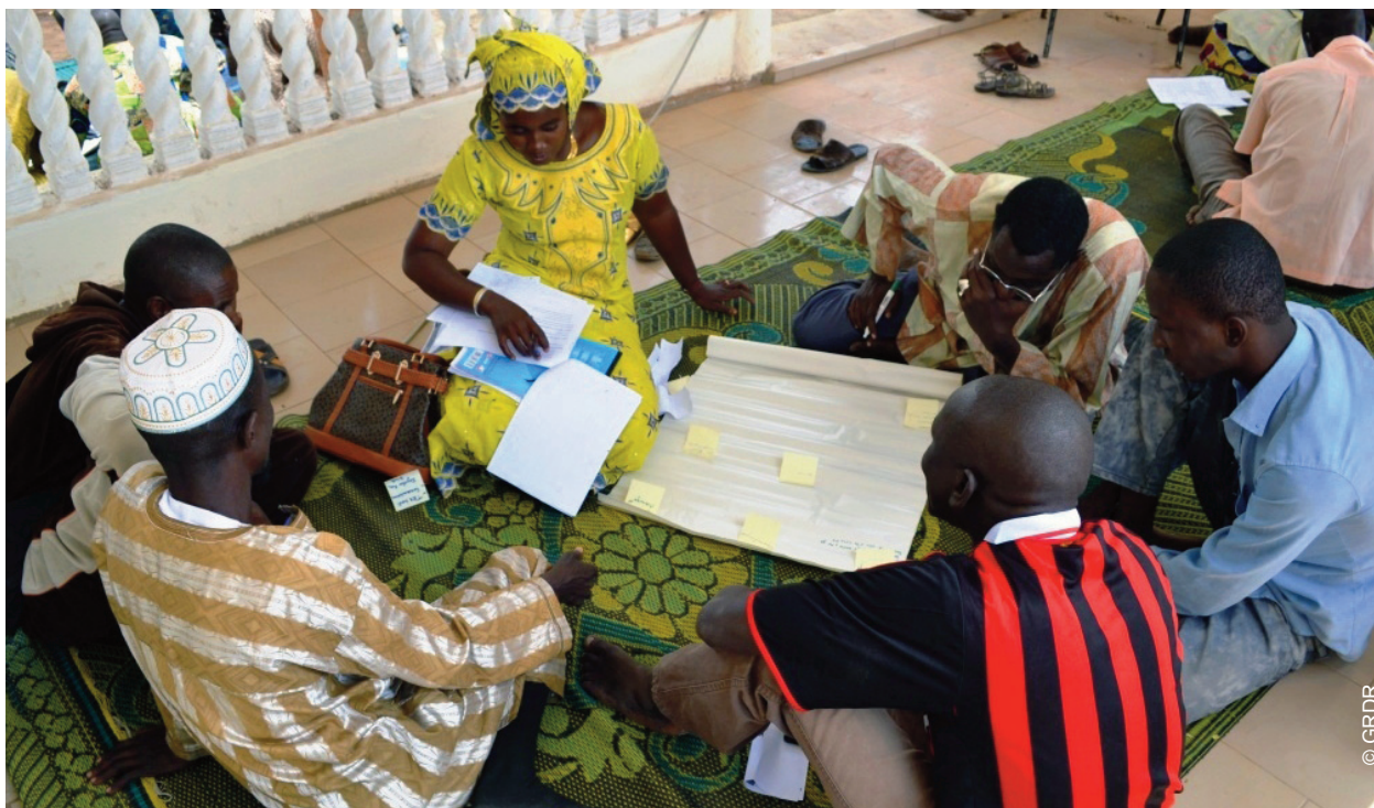
Thé palabre, travaux de groupe - Kayes, Mali - Projet GRDR / CRK - EMDK

CFSI : des expériences partagées sur quatre continents